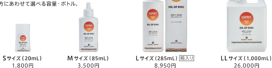
Sサイズ (20mL) 1,800円